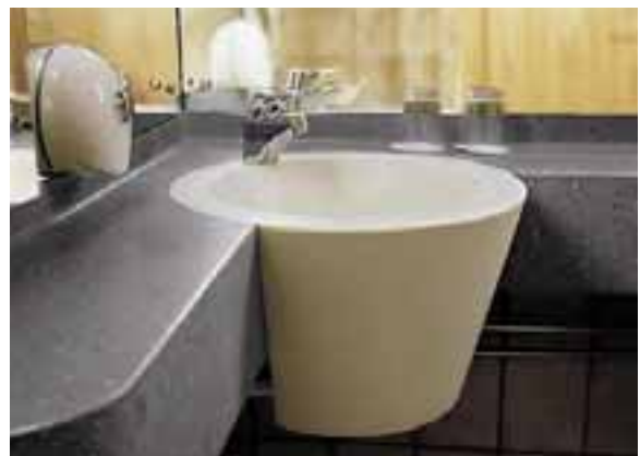
HÔTEL RADISSON SAS ROYAL VIKING, STOCKHOLM, SUÈDE. DESIGN SNICKARBOLAGET. PLAN DE TOILETTE ET LAVABO EN CORIAN® CAMEO WHITE ET CORIAN® GRAY FIELDSTONE.