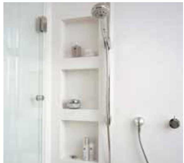
PAROIS DE DOUCHE INTÉGRALES AVEC ÉTAGÈRES INCORPORÉES. DESIGN CHARLES ZÄCH.