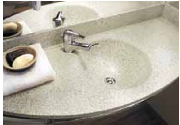
NOVOTEL, ROTTERDAM, PAYS-BAS. PLAN-VASQUE "TOUT EN UN" EN CORIAN® PYRENEES.

Sur le plan fonctionnel, Corian® garantit une hygiène irréprochable. Ses éléments massifs et non poreux s'assemblent sans joints perceptibles, créant ainsi des lavabos intégrés et des plans-vasques d'une pièce, simples et faciles à nettoyer et à entretenir.