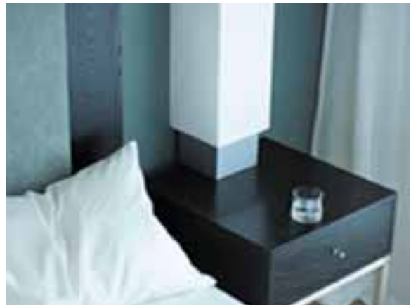
TABLE DE NUIT EN CORIAN® NOCTURNE.

Ici, une table de nuit profile ses contours nets et épurés; là, une étagère design épouse avec goût les contours d'un angle serré; là encore, la tablette du bureau accueille l'ordinateur portable comme le plateau du service d'étage.