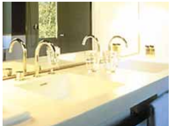
"THE HOTEL", LUCERNE, SUISSE. DESIGN JEAN NOUVEL. PLAN DE TOILETTE ET VASQUE D'UN SEUL TENANT EN CORIAN® GLACIER WHITE.