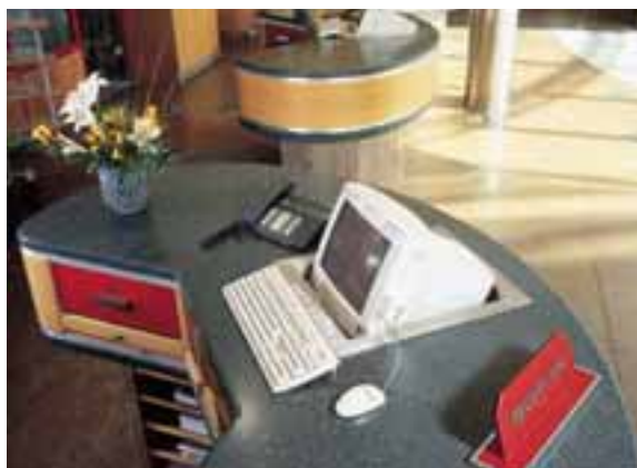
HÔTEL MÖVENPICK, OBERURSEL, ALLEMAGNE. TROIS COMPTOIRS DE RÉCEPTION EN CORIAN® RAIN FOREST ET EN BOIS.